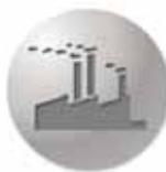
Imagen de marca y Seguridad...